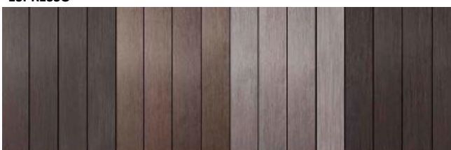
Dopo installazione Dopo 1 anno Dopo pulizia Dopo manutenzione