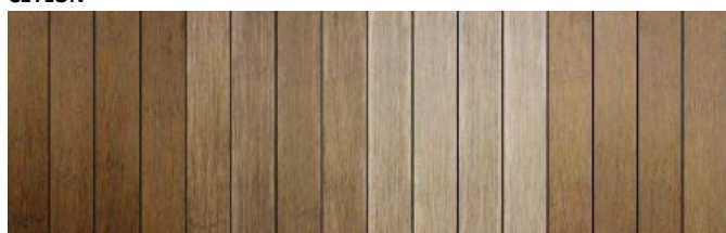
Dopo installazione Dopo 1 anno Dopo pulizia Dopo manutenzione