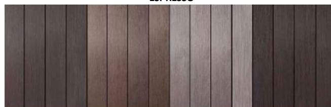
Dopo installazione dopo 1 anno dopo pulizia dopo manutenzione