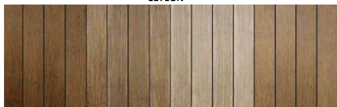
Dopo installazione dopo 1 anno dopo pulizia dopo manutenzione