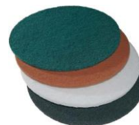
Mopas Bona Ø 407 mm 25 mm

Roja (art. AAS867300048) Marrón (art. AAS867300068)