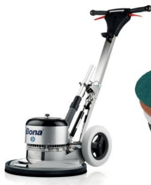
Monocepillo Bona FlexiSand 1.5