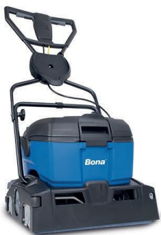
Máquina limpiadora Bona PowerScrubber